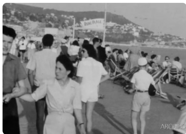
Nice (1950 environ)