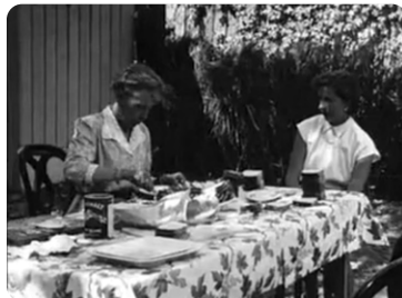
J'ai quitté l'Aquitaine

Projection du 24 octobre à l'Espace Mignan