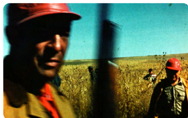
Journal d'Amérique