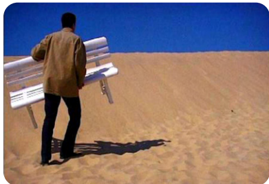
J'ai quitté l'Aquitaine ©Adav Europe