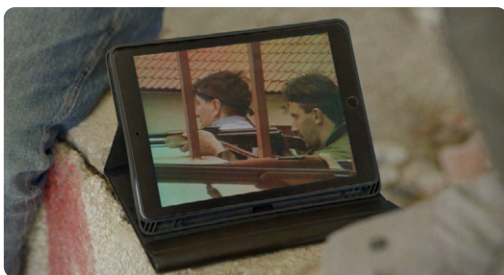
Affronter l'obscurité

Ciné-concert et projection du 27 et du 28 octobre à La Trésorerie et au Pop-Up Cinéma du 109