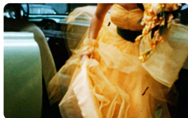
Journal d'Amérique

Projection du 23 octobre à l'Institut audiovisuel de Monaco