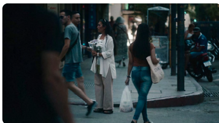
Las cosas indefinidas

Projection du 26 octobre à la Villa Arson