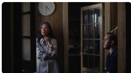
Las cosas indefinidas

Projection en avant première du film inédit en France, Las Cosas Indefinidas (2023, 86 min.) de Maria Aparicio , en partenariat avec le FID Marseille